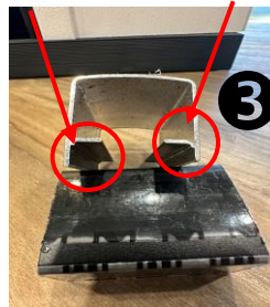
Côté de la planche

Utilisez le Guide d'espacement fourni par Fiberwood (2 guides inclus). Attention il a un rebord plus long à utiliser pour le côté où les planches s'emboîtent une à l'autre.