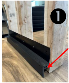
Moultre de départ